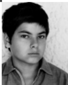
Ο Λεωνίδας. Γλυφάδα, 1969