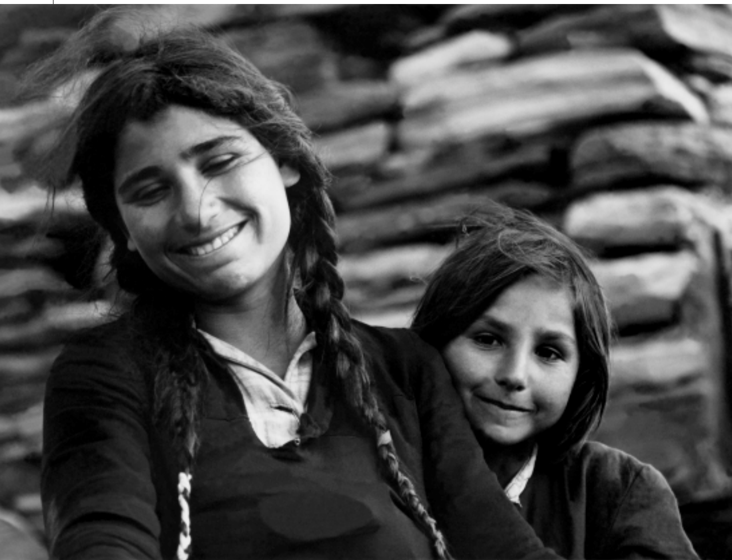
Τσιγγάνες. Μπασιί, 1954