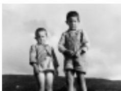
Αγοράκια. Μπασιί, 1953

Είναι γνωστό ότι ο ποιητής και πεζογράφος Ανδρέας Εμπειρικός ήταν συγχρόνως και ενθουσιώδης φωτογράφος, οι φωτογραφίες του όμως παρέμειναν για πολύ καιρό άγνωστες. Μία και μοναδική φορά παρουσίασε στο κοινό τα φωτογραφικά του έργα ο Εμπειρικός: το 1955, στην Αίθουσα Ιλισός της οδού Αμερικής 13. Η έκθεση, που συμπεριλάμβανε τον εκπληκτικό αριθμό των 210 εκθεμάτων, κράτησε λίγες μέρες, από τις 22 Ιανουαρίου μέχρι τις 12 Φεβρουαρίου, και δεν είχε συνέχεια. Έκτοτε, και με μοναδική εξαίρεση το άρθρο του Δημήτρη Καλοκύρη “Ανδρέας Εμπειρικός, ο φωτογράφος” στο δέκατο τεύχος του περιοδικού ΦΩΤΟΓΡΑΦΟΣ το 1991, το φωτογραφικό έργο του κορυφαίου Έλληνα υπερρεαλιστή έμεινε τυλιγμένο στο σκοτάδι. Το έργο αυτό αποτελεί μέρος του Αρχείου Εμπειρικού, όπως πρόσφατα, απεκάλυψε ο γιος του Εμπειρικού, Λεωνίδα: “Υπάρχει και το τεράστιο, ιλιγγιωδών διαστάσεων, φωτογραφικό αρχείο, το μόνο καταλογοποιημένο στην εντέλεια από τον ίδιο, το οποίο ουσιαστικά κατέχει θέση ημερολογίου ποιητικής αναφοράς, αλλά και εικαστικής εκδήλωσης, δείχνοντας, εξάλλου, και μία πρώιμη σχέση του τόσο με το φορμαλισμό όσο και με άλλα καλλιτεχνικά ρεύματα του 20ού αιώνα. Ένα μεγάλο μέρος του αρχείου αυτού είναι επιλεγμένο από τον ίδιο με τη μορφή μεγεθυμένων φωτογραφιών από τα δοκίμια του αρχείου - τα αρνητικά μπορεί να ανέρχονται από το 47-48 και έπειτα σε πάνω από 30.000.”