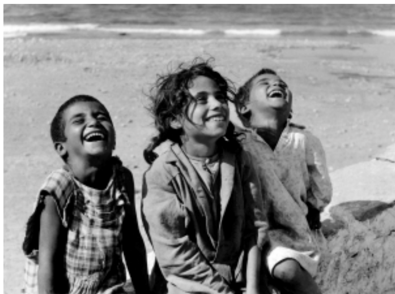
Τσιγγανάκια. Πάρος, 1954