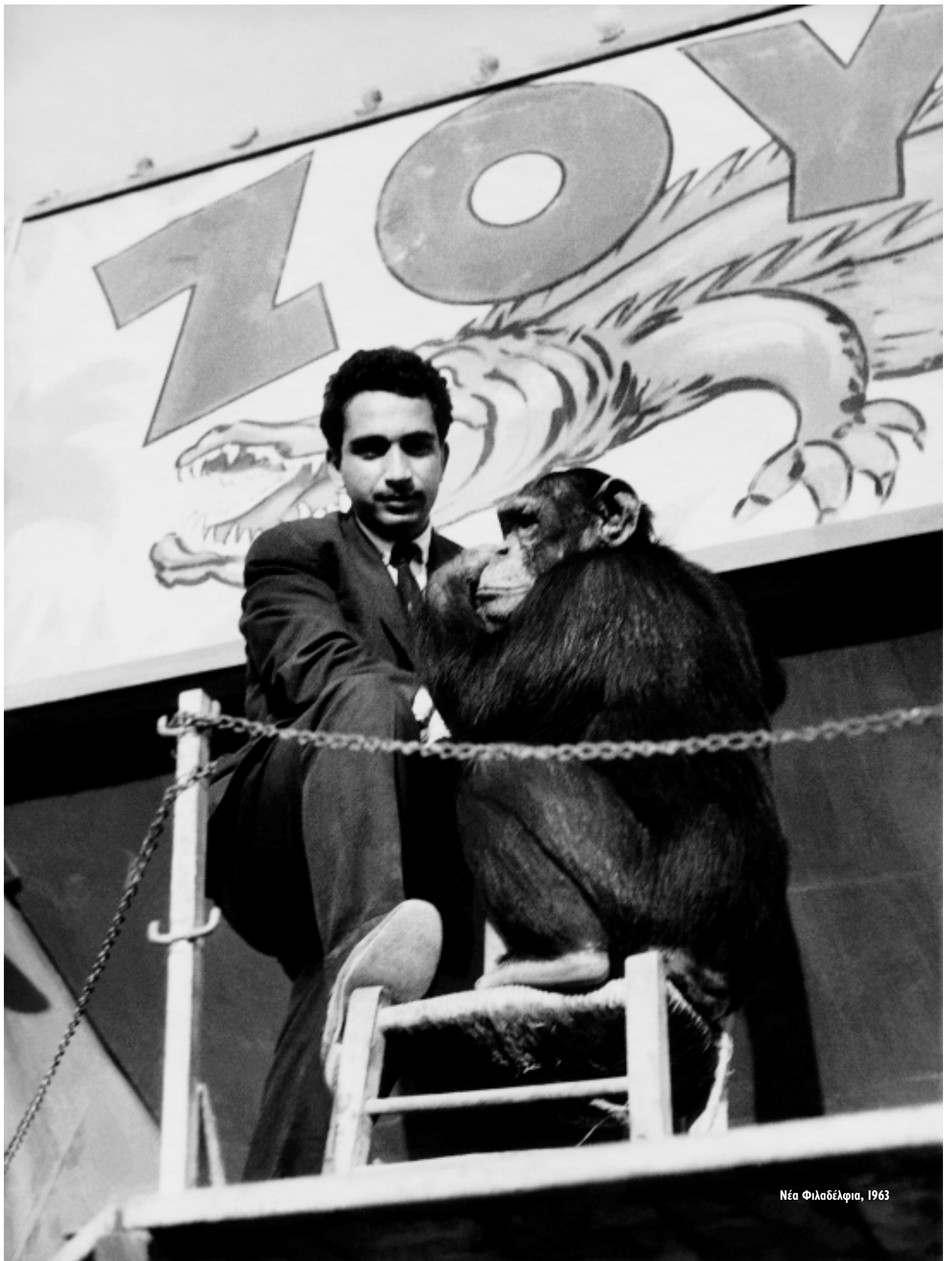
Νέα Φιλαδέλφια, 1963