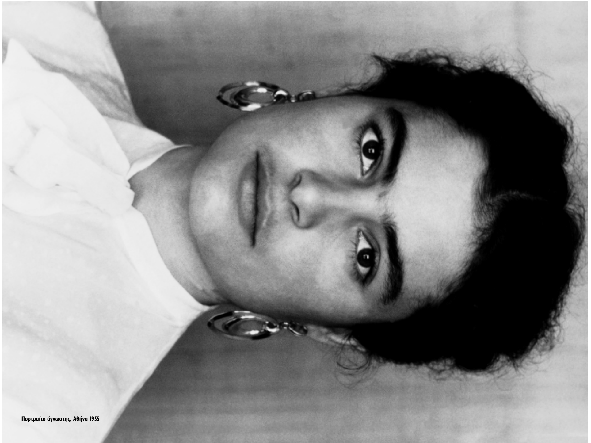
Πορτραίτο άγνωστης, Αθήνα 1955