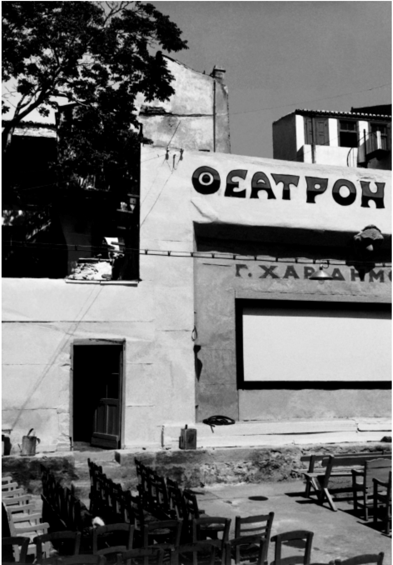
Θέατρο Χαριδημού. Πειραιάς, 1955