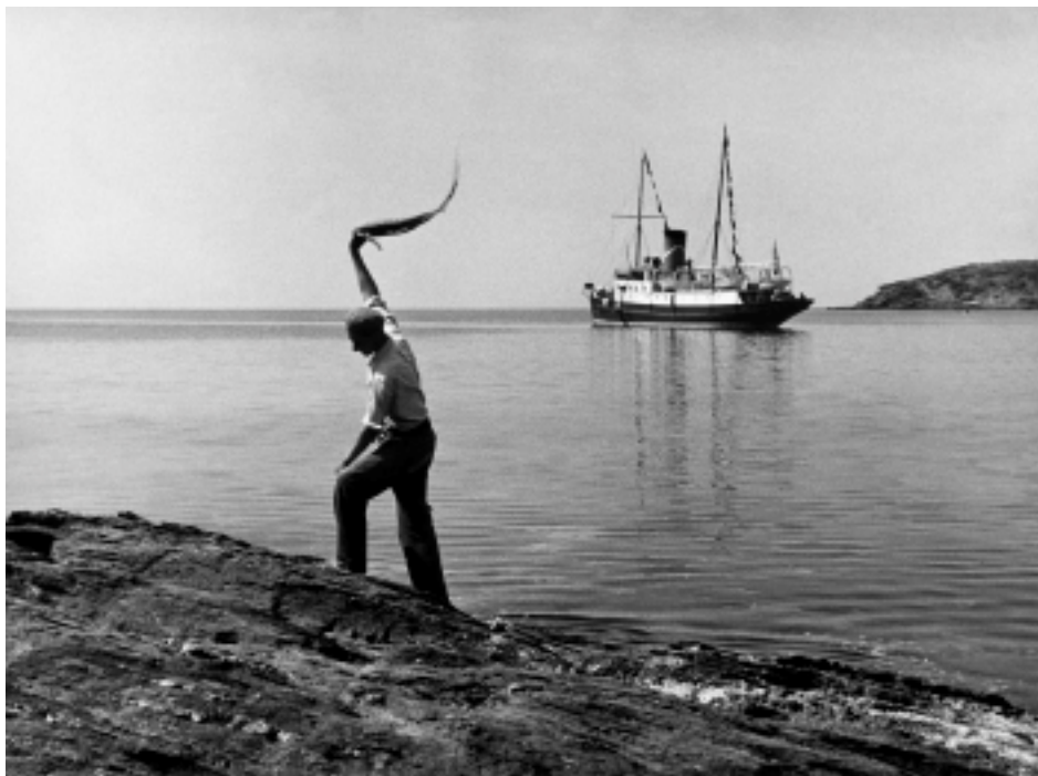
Παράλια, π. 1955